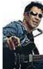
Napoli Edoardo Bennato, 69 anni, pubblica venerdì il nuovo cd «Pronti a salpare»