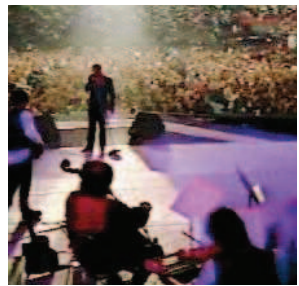
L'ULTIMO TOUR Nel '94 un tour in Italia e in Europa sempre tutto esaurito. Otto milioni di telespettatori sulla Rai per la diretta dell'ultimo show al Forum di Assago