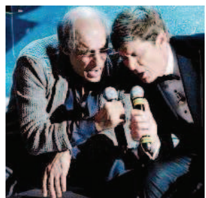
SANREMO 2012 L'intervento con Morandi su politica e religione. Attacchi ad Avvenire e Famiglia Cristiana . Nella serata finale Adriano viene contestato