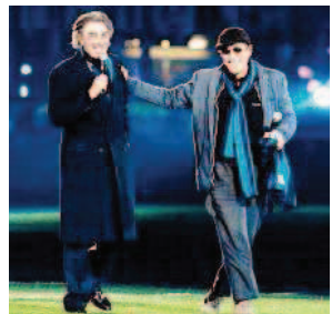
ALLA FESTA INTERISTA L'8 marzo del 2008 allo stadio di San Siro di Milano canta Il ragazzo della via Gluck per festeggiare il centenario dell'Inter