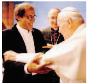
PER PAPA WOJTYLA Nel 1997 si esibisce di fronte a Giovanni Paolo II, assieme a Bob Dylan, al Meeting Eucaristico di Bologna: canta Preghevo Disse e Ciao ragazzi